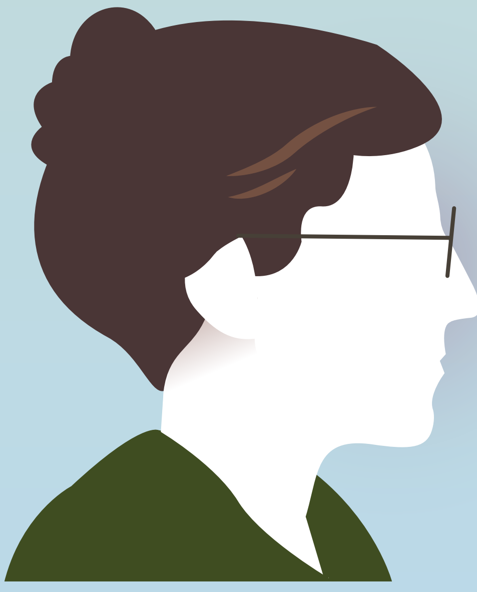
لوسي مود مونتغمري 1874-1942

نشأت مونتغمري مهملة بدون أم، وأب بعيد تمامًا مثل البطلة آن شرلي. لقد صورت الكاتبة ولع آن الشديد بالتعليم وحبها لجزيرة الأمير إدوارد، ولكنها مع تصاعد السلسلة منحت بطلتها مرحلة بلوغ مليئة وسعيدة لم تحصل عليها هي نفسها.