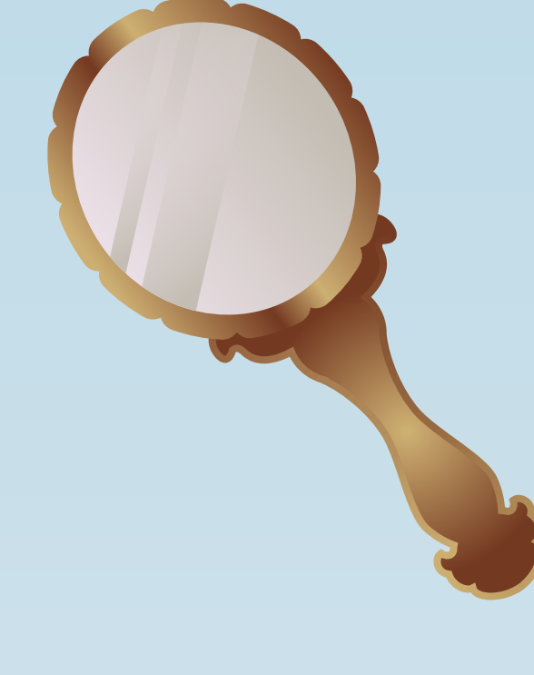
التحيز ضد ذوات الشعر الأحمر

أُلجئ أكثر من 100 ألف طفل مشرد إلى العائلات الكندية في الفترة بين 1869 إلى 1932.